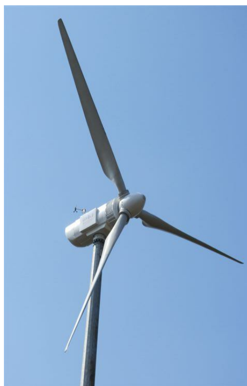
Turbina MRG15 installata a Marsala (TP)